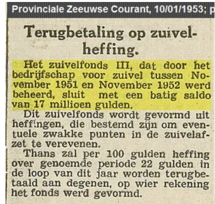
Zuivelfonds-III 1951/1952 afsluiting

Het inkoopbureau voor zuivel (I.V.Z.), waar de industrie tijdelijke overschotten kan inleveren, beschikt nog over 1651 ton boter, doch heeft geen kaas of melkpoeder in voorraad. Zoals de zaken thans staan zal de verkoop van deze boter het batig saldo eerder vergroten dan verkleinen. Eind April kan het Zuivelfonds-III definitief worden afgesloten.