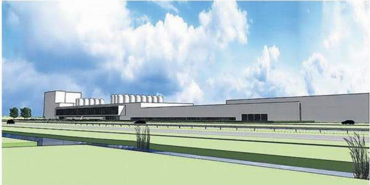
Artists impression van de nieuwe zuivelreus in Heerenveen.

LEEUWARDER COURANT 08 januari 2013, pag. 18