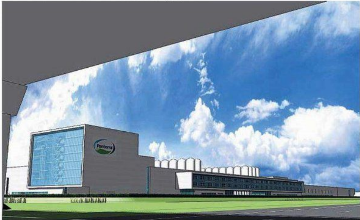
Een artist impression van het 500 meter lange fabriekscomplex in Heerenveen. Hier zullen vanaf eind 2014 kaas en wei-ingrediënten gemaakt worden. ILLUSTRATIE BERT VAN DER PLOEG