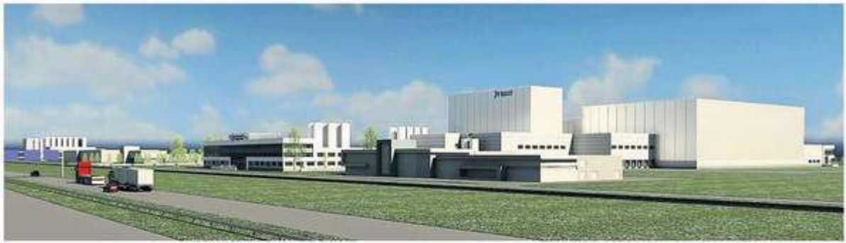
Deze schets toont het nieuwe complex, gezien vanaf de A7. Het grijze pand vooraan is van een ander bedrijf. De eerste fase (meng- en verpakkingsfaciliteiten en magazijn) is eind 2014 klaar. ALPHA ARCHITECTEN HANLINGS

HEERENVEEN - Zuivelbedrijf Ausnutria Hyproca wordt bestookt door ondernemers die goederen en diensten willen leveren aan de babyvoedingfabriek in Heerenveen.