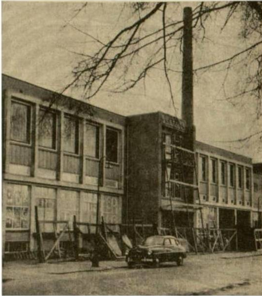
De „Leeuwarder Coöperatieve Melkinrichting”, vroeger de „Zuivelfabriek Emmakade”, in wording. Boven de ingang ligt de ontvangstzaal voor excursisten. Voorts komen op de bovenverdieping de kantoorlokalen.