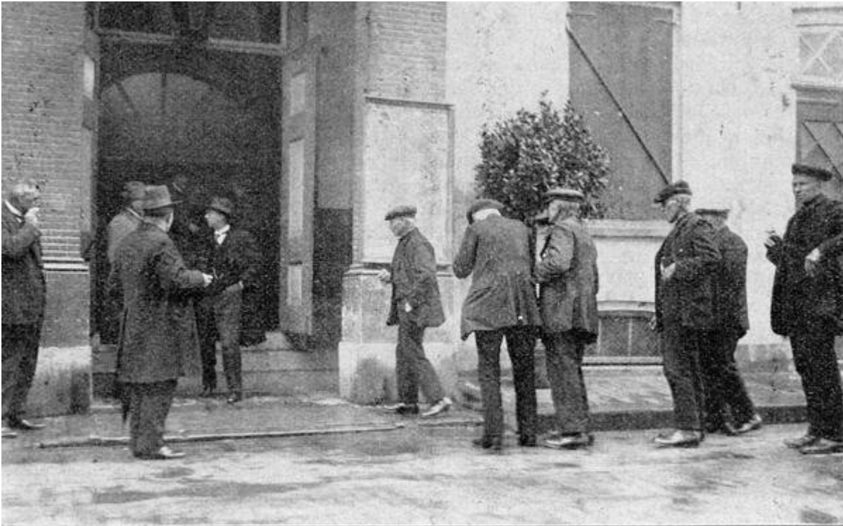
Deelnemers op weg naar de feestvergadering.

Zoo zijn wij dan thans naar de stad van den wijnhuistoren geweest om feest te vieren. Het 25-jarig bestaan van den Geldersch-Overijsselschen Bond van Coöp. Zuivelfabrieken was niet gevierd, omdat de tijdsomstandigheden hiertoe toen niet meewerkten en een zware ziekte den secretaris tijdelijk buiten dienst gesteld had. Deze is thans weer volkomen hersteld en op volle kracht van zijn werk, zoodat er ook, gezien den bloeienden toestand waarin de bond verkeert, alle aanleiding was het 30-jarig bestaan feestelijk te vieren.