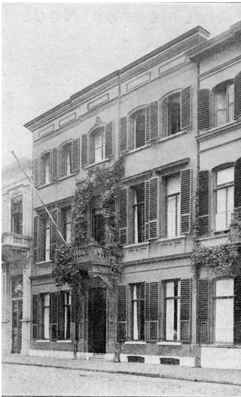
Bondsgebouw IJsselkade 7, Zutphen.

Vooraf ter wille van den afzet van het product werd de Bond in 1897 lid van den Ned. Coöp. Bond. Van de tusschenkomst van deze vereeniging had men nogal eenige verwachting t.o.v. den