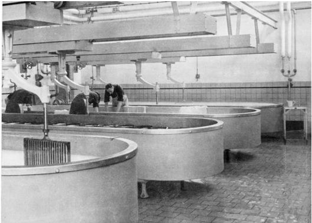
Yn 'e tsüismakkerij

Ut molke de tsüssstof De wrongel lietet, De tsüts yn it doelje En dan yn it fet