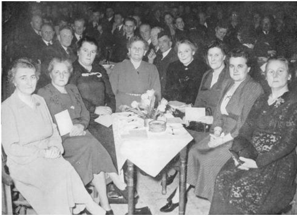
Froulju fan bistjársleden yn noflik rountsje op it feest