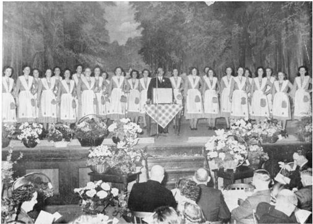
De fammen fan Heech, de blom fan it Fryske lân. bitsjinnen de gasten mei rynske hân

wurdt, mar ek hwat de foerfoarsjenning en rju oare dingen en mooglikheden oanbilanget stiet it fabryk mids it boerelibben. It fabryk wurdt der yn bihelle as der melkerskursussen hâlden wurde, en op fokfêdagen en mear jowe direksje en bistjûr blyk fan bilangstelling, koartsein: it fabryk libbet deun by de boarne, de groun, it fé, de buorkerij ; it is fan en foar de boer. Al is foar goed fyftich jier it búter- en tsiismeitsjen fan de pleats nei it fabryk oergien, it is like goed in ûnderdiel fan syn bidriuw bleaun, wylst it tagelyk forbân leit mei oare lannen en sa in skeakel foarmt tusken hoarnleger, dêr't it skoane produkt woun wurdt, en de wrâld, dêr't it yn 'e foarm fan búter en tsiis forhannele wurdt, de tafel fan 'e konsumint fynt en de namme fan dit Fryske produkt oer sêen en lannen fiert.