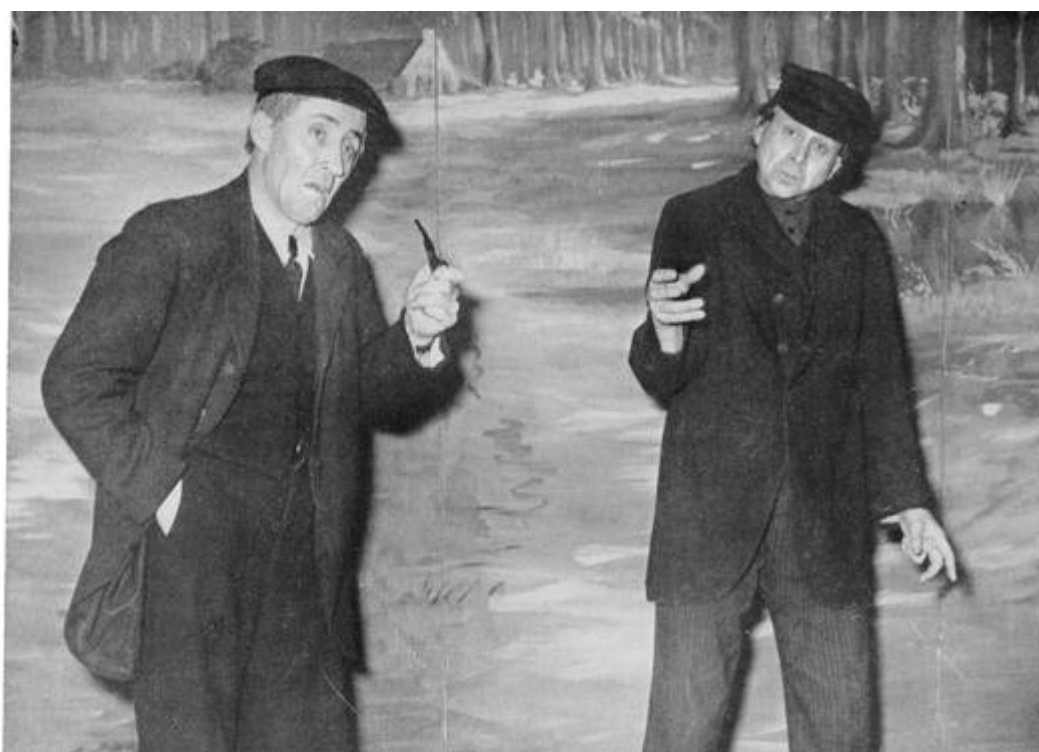
Gurbe en Gouke op it gouden feest

Gurbe : Bigrypstou dat net ? Ik wol der mei sizze, dat de namme Heech foar Heech tige fan pas is.