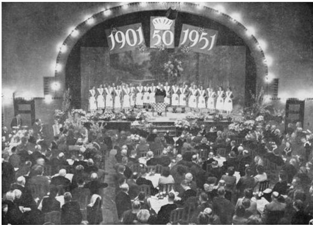
Yn 'e romme seal fan it gebou foar Kr. Bilangen to Snits waerd it fyftich-jierrich birstean fan it fabryk bitocht

foar harren de koöperaasje fan Heech in tuskenstasjon west dêr't hja langer of koarter tiid tahâlden hiene.