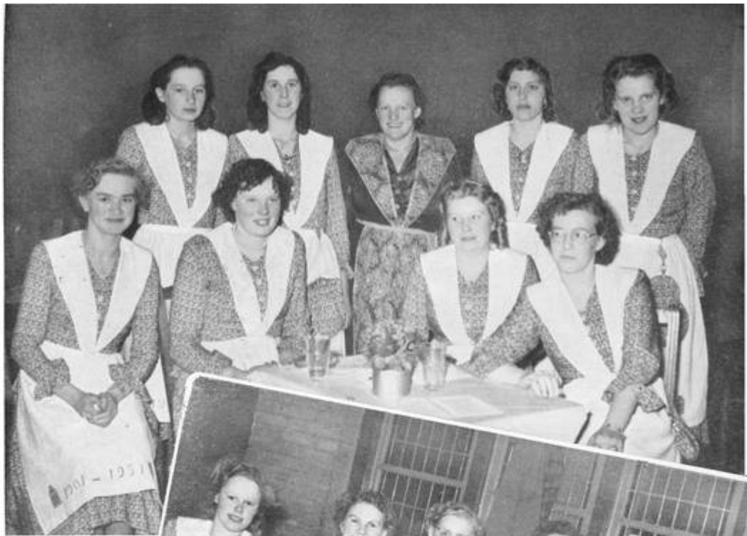
Trije ploegen fammen dy 't de gasten letten en setten