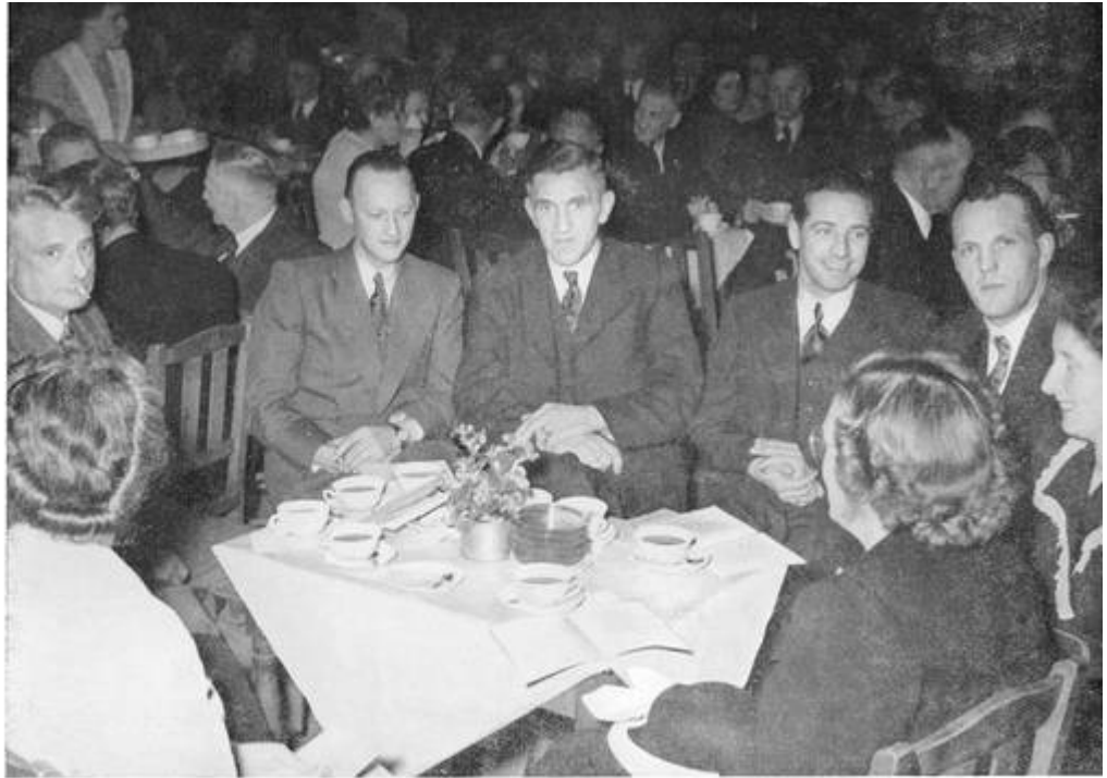
Ald assistinten fan it fabryk to Heech

Yn 1907 hie men der klauwen oan : der wie mei de konkurrinsje lyk-op útbittelle, en dat hie de brune net lúke kinnen. Oan 'e ein fan it boekjier wie de balâns út 'e blâns, der wie in neidielich saldo en ynsté fan it potsje, dat altyd wolkom wie en dêr't mûlk op tidige waerd, moast der hwat fan it molkjild yn de pôt werom rûgelje.