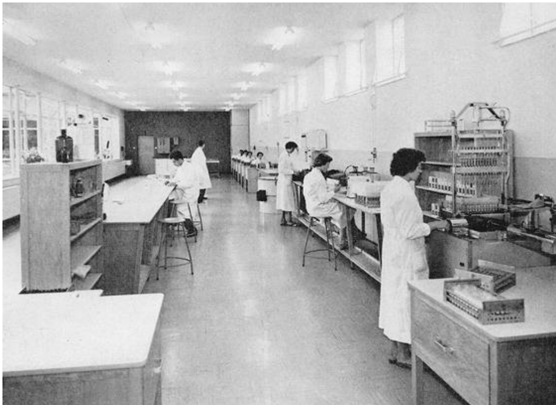
Interieur van het eiwitlaboratorium van de Zuivelbond

De technici kunnen ook voorlichting geven over de te gebruiken apparatuur en over verbeteringen in de werkwijze.