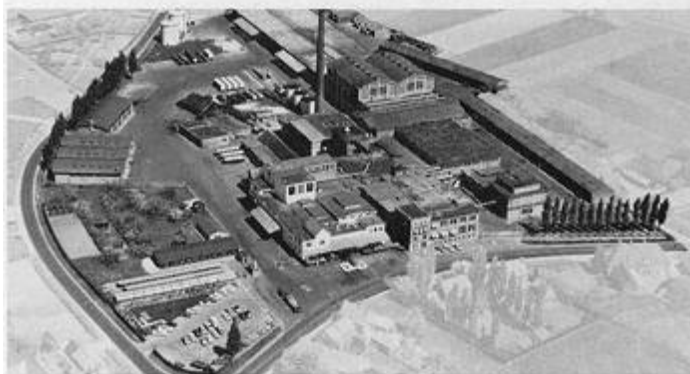
. . . de Centrale Melkproductiefabriek „Bergeyk“ te Bergeyk, twee van de drie centrale bedrijven van de CZNZ.

Dit jaar, weer twintig jaar later, is de melkstroom gestegen tot 710 miljoen kg per jaar, die geleverd wordt door 16.250 veehouders en verwerkt door 30 bij de ZNZ aangesloten fabrieken. In de laatste twintig jaar halveerde ongeveer het aantal melkleverende veehouders, terwijl de hoeveelheid melk, die door de fabrieken wordt verwerkt, in die tijd twee en een half keer zo groot werd.