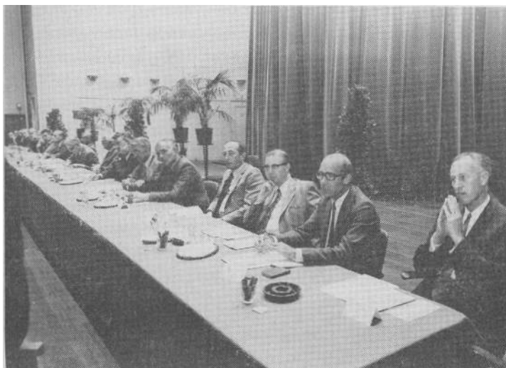
Een overzicht van beide zijden van de bestuurstafel.