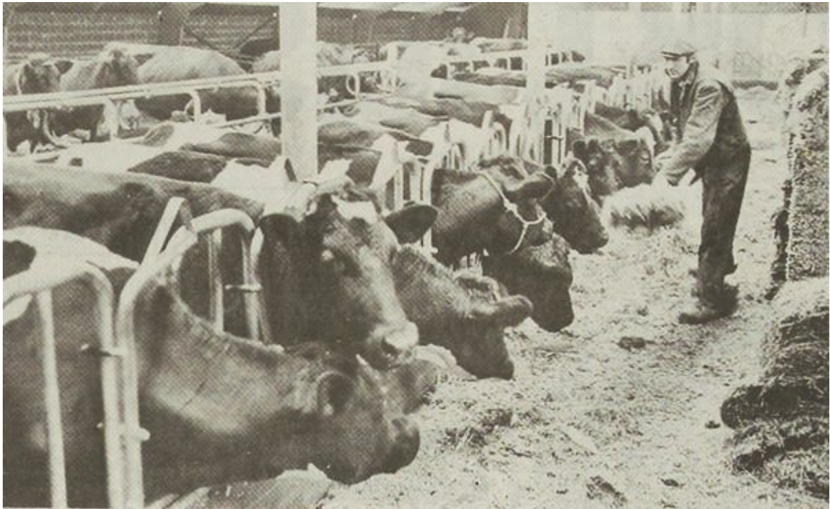
Boer Vader in de ligboxenstal

val niet zoveel over, dus we hebben er ook niet zozeer bij stil gestaan. Ik heb gezegd, je moet wat durven ook. En voor de bedrijfsvoering ben ik blij met de nieuwe stal”.