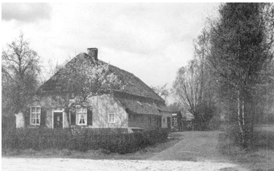
Een boerenbehuizing van een vroegere peelwerker/boer

De politiek, landbouworganisaties, het Ministerie van Landbouw, Provinciale Staten, alles werkte mee om de ontsluiting, ontginning en waterbeheersing te realiseren. We hebben nog steeds bewondering voor de initiatiefnemers die in betrekkelijk korte tijd goede resultaten wisten te bereiken. Doordat de boeren en andere plattelanders zelf die ontwikkeling voor een groot deel stuurden, is daar ook een zeer grote vorming van uitgegaan.