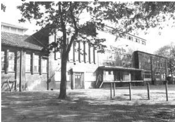
De huidige zuivelfabriek te Vorden.

op poten zetten, zijn praktisch vergeten.