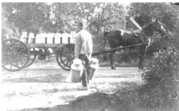
Hier zo'n melkwagen met smalle velgen, ook in Vorden een omstreden gebruiksmiddel.

Op 2 april 1894 begon het bedrijf te draaien. Deze eerste dag werd 2.500 liter melk verwerkt. Het getal koeien waarvan melk geleverd kon worden, bedroeg 385. Knap veel voor die dagen, want op een landbouwcongres in 1885 was toen net vastgesteld: 'Kleine fabriekjes met ongeveer 100 koeien, dat was voldoende, want de ene boer kan dan de andere boer beter controleren'.