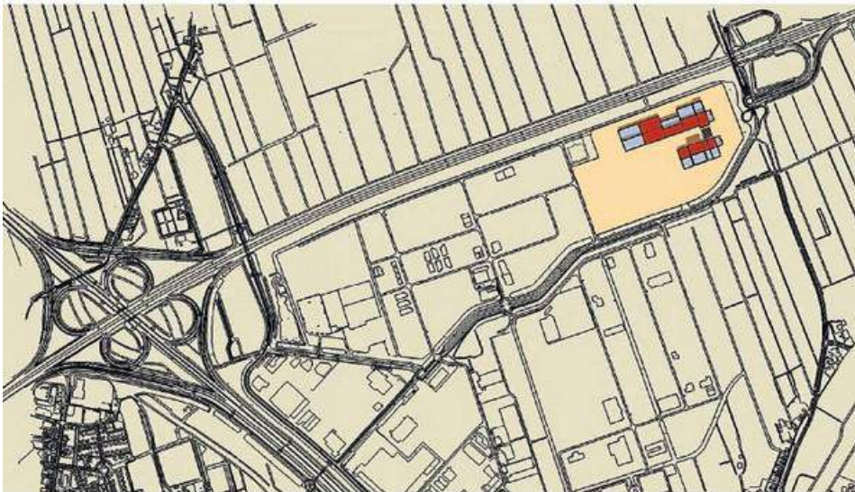
De locatie van de nieuwe kaasfabriek op bedrijventerrein Heerenveen-IBF Tjalleberd, ten zuiden van de A7 richting Drachten.

HEERENVEEN - Bij de A-ware Food Group weten ze veel van kaas, maar kaasmaken? De fabriek in Heerenveen is voor het handelshuis een nieuw avontuur.