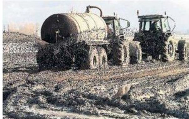
▲ Veehouders rijden hun mest lang niet altijd uit.

De aanleg van riolering in steden wordt wel genoemd als één van de belangrijkste medische doorbraken van de afgelopen eeuwen. Het feit dat urine en uitwerpselen konden worden weggespoeld zorgde voor een ongekende daling in ziekte en stijging van de levensverwachting. Dat mensen ziek worden van virussen en bacteriën in ontlasting was toen nog niet bekend, maar nu wel. Des te opmerkelijker dat geen haan lijkt te kraaien naar de enorme hoeveelheid mest van de Nederlandse veestapel, die met de afschaffing van het melkquotum in april 2015 alleen maar verder zal groeien. In de provincie Groningen leefden in 2013 zo'n zes miljoen kippen, 150.000 varkens, 80.000 schapen en 180.000 koeien, naast 580.000 Groningers. En het worden er steeds meer.