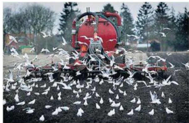
▲ Mest wordt geïnjecteerd in de bodem bij Kielwindeweer.

De geplaatste foto bij het artikel (uit het archief) geeft een onjuist beeld. Ook zou er sprake zijn van mestfraude. LTO werkt samen met de overheid aan oplossingen om fraude met mest te voorkomen. Hierbij ligt de focus op de provincies met een overschot, en daar hoort Groningen zeker niet bij.