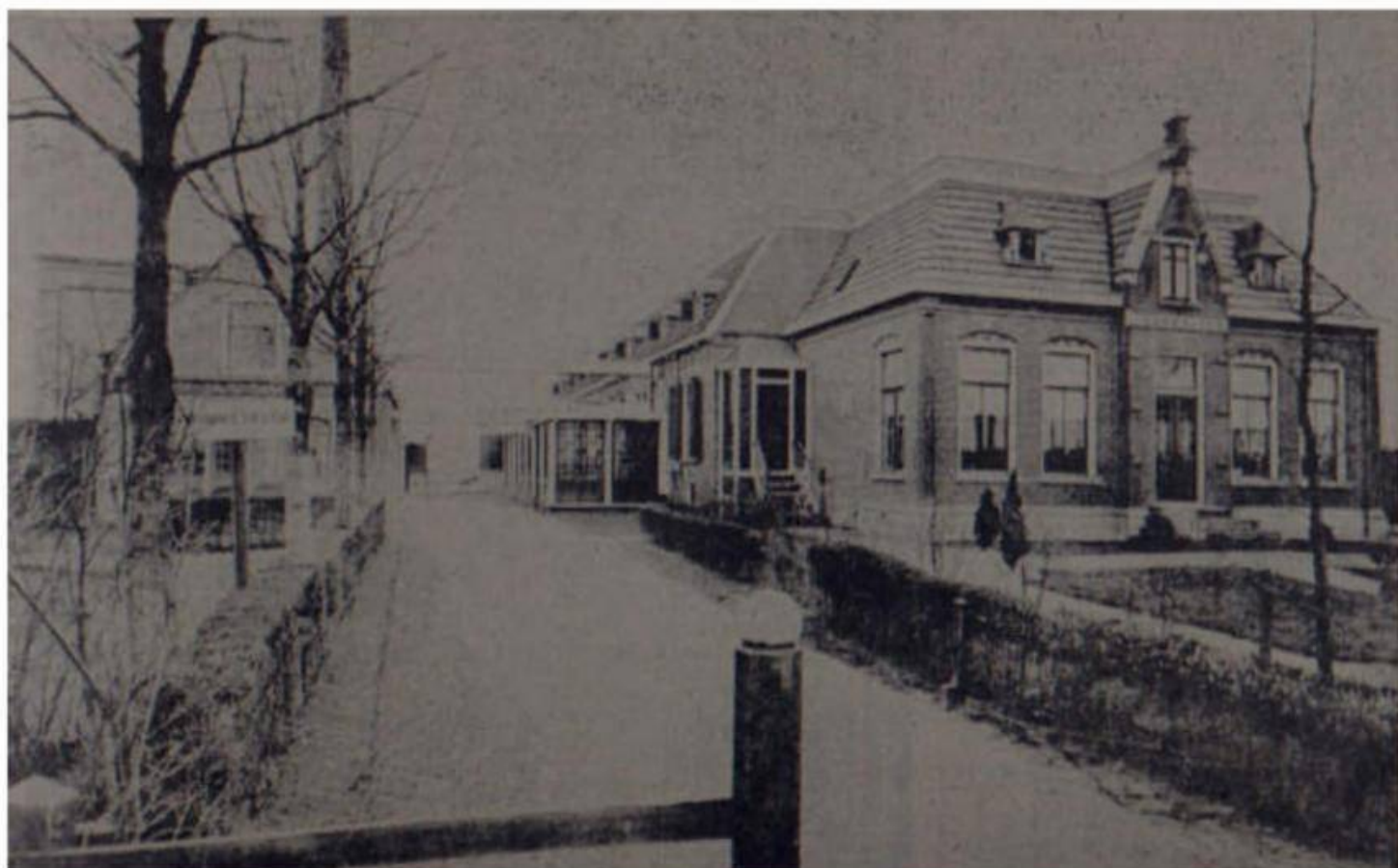
Het zuivelcomplex „Trynwâlden en omkrite” rond 1912