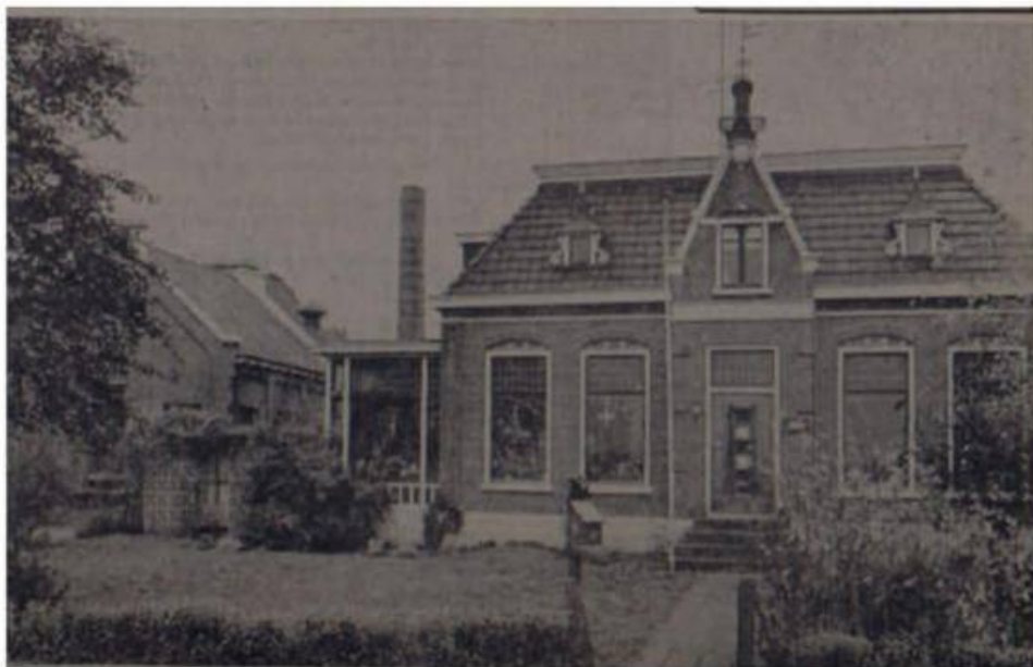
Nu biedt het pand huisvesting aan een aantal plaatselijke bedrijven.

Lange tijd vormde het aldus ontstane zuivelcomplex van „Trynwâlden en omkritten“ het centrum van bedrijvigheid in Giekerk . De melk van de boeren uit de verre omtrek kwam hier naar toe. Lange tijd kon deze coöperatie weerstand bieden tegen fusies die her en der in Friesland plaatsvonden. In 1976 was daar echter niet meer aan te ontkomen. Zo langzamerhand wordt het voormalige zuivelcomplex echter wel weer het centrum van bedrijvigheid in Giekerk .